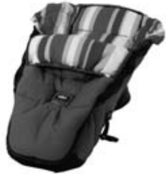
»Fußsack T-Lift S

Sobald Ihr Kind anfängt zu sitzen, muß der Spezialboden der T-Lift / M-Lift nicht unbedingt entfernt werden. Einfach den Halteriemens am Kopfteil lösen und den Rücken nach oben stellen. Der Boden kann nicht brechen und eine umständliche Handhabung wie der Wechsel zwischen Umbau Fußsack / Umbau in Tragetasche wird vermieden. Sobald Ihr Kind richtig und für längere Zeit sitzt, muss zum Fußsack umgebaut werden.